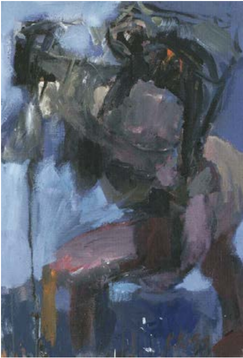
Übers Wasser 1991, 73 x 102 cm Acryl auf Karton