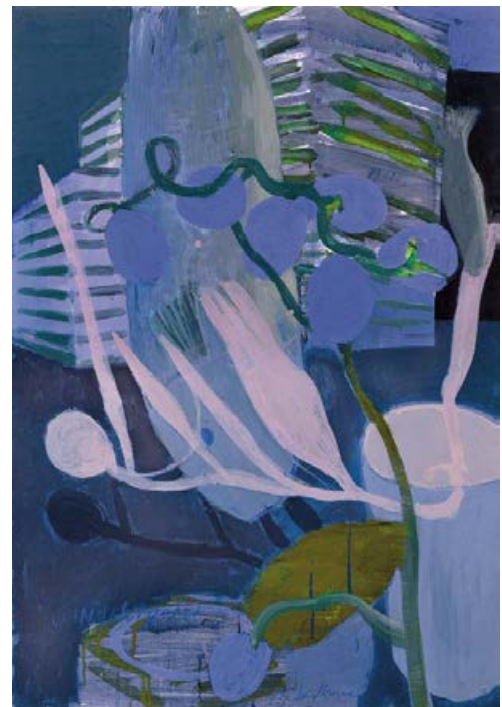
Nachtgebet 1999, 73 x 102 cm Acryl auf Karton

Anders die Metamorphose zu Joseph Anton Koch, dessen klassizistischer Gestus nichts mit Urs Graf und auch wenig mit den Intentionen der Künstlerin gemein hat. So wird mit der Pastorale (S. 15) nach Joseph Anton Kochs Schmadribachfall (1822) auch nur ein kleiner, eher untypischer Ausschnitt der Kochschen Malerei variiert. Alles Großartige, Heroische seiner Komposition verliert sich bei der Malerin in einer