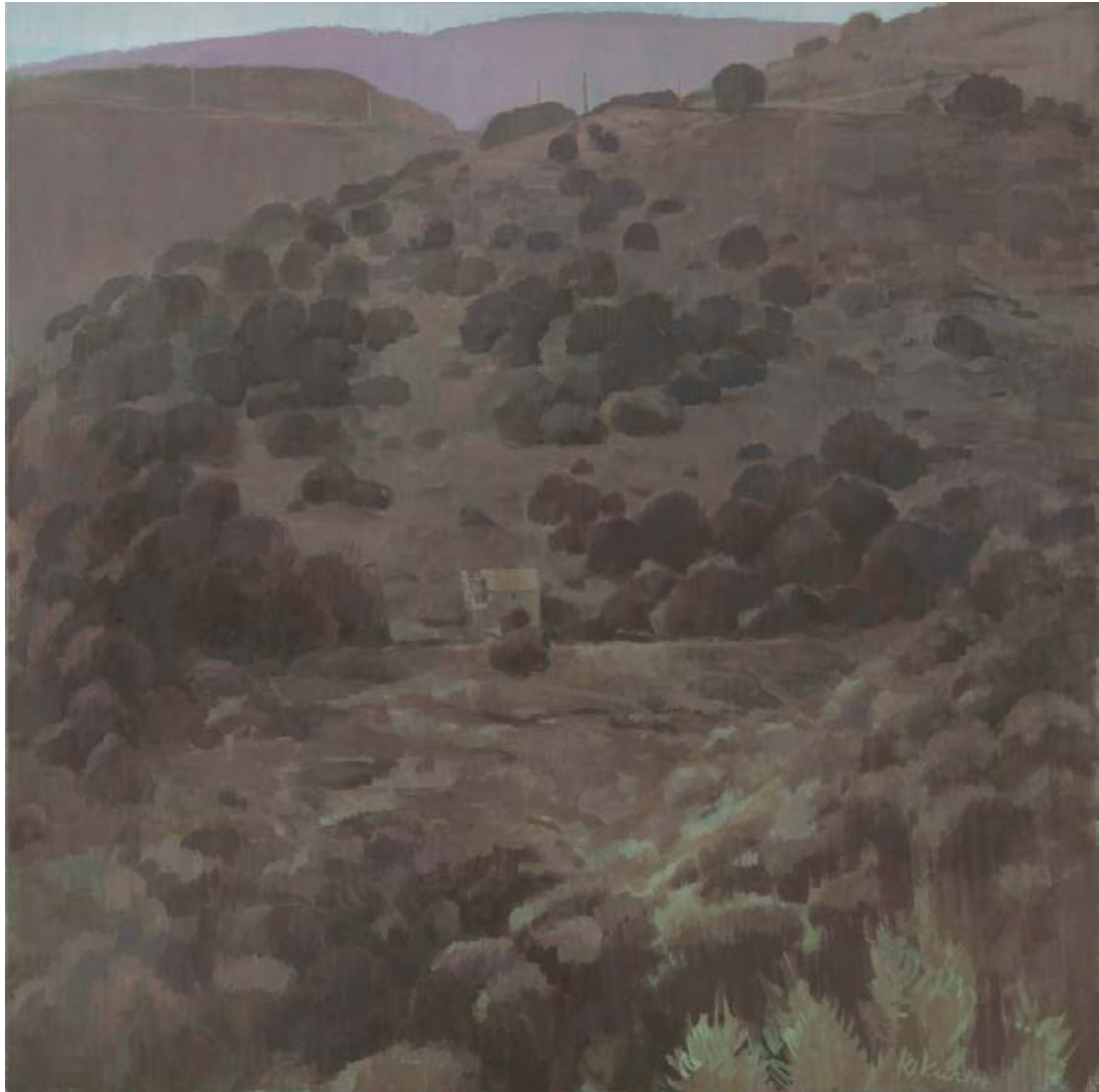
In den Cévennes 2008, 105 x 105 cm Mischtechnik auf Leinwand