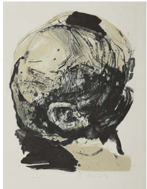
Ganz Ohr , aus Findlinge 1999, 50 x 64 cm Lithografie