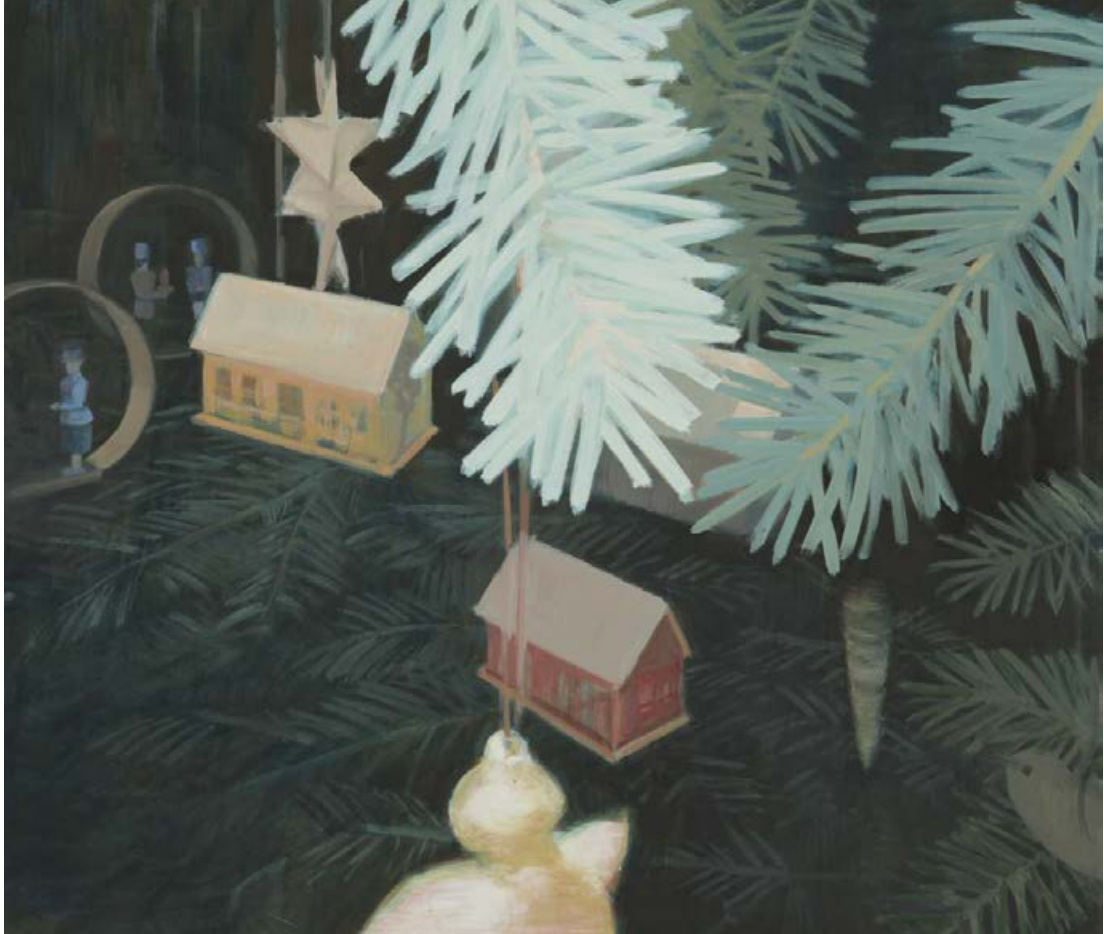
Am Baum I 2007, 80 x 70 cm Mischtechnik auf Leinwand