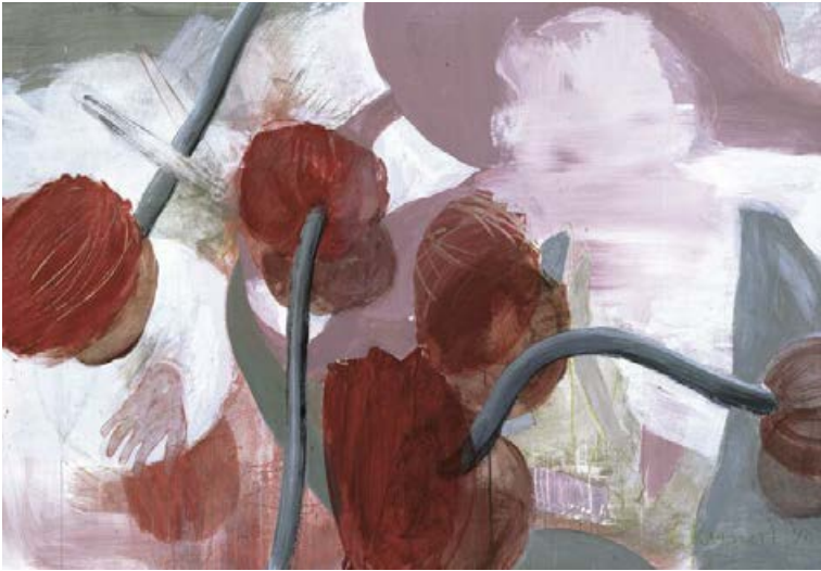
Maria und die Tulpen 1998, 140 x 100 cm Acryl auf Karton

begreift Malen nun auch als handwerklichen Prozess, aus dem heraus das andere, die Kunst, wachsen kann. Der Malvorgang verlangsamt sich entsprechend. Das Mischen der Pigmente, das Schichten und Auftragen der Farben, die Imprimitur darunter, all das schreibt sich als Zeit, als Konzentration in ihre Bilder ein, löst die Unmittelbarkeit des Ausdrucks ab. Ihre Bilder wachsen quasi von unten nach oben, nicht mehr von außen nach innen. Das Gestische tritt zurück, wird von den Flächenschichtungen aufgefangen, dort gesammelt, umgeformt in eine andere Bildwelt.