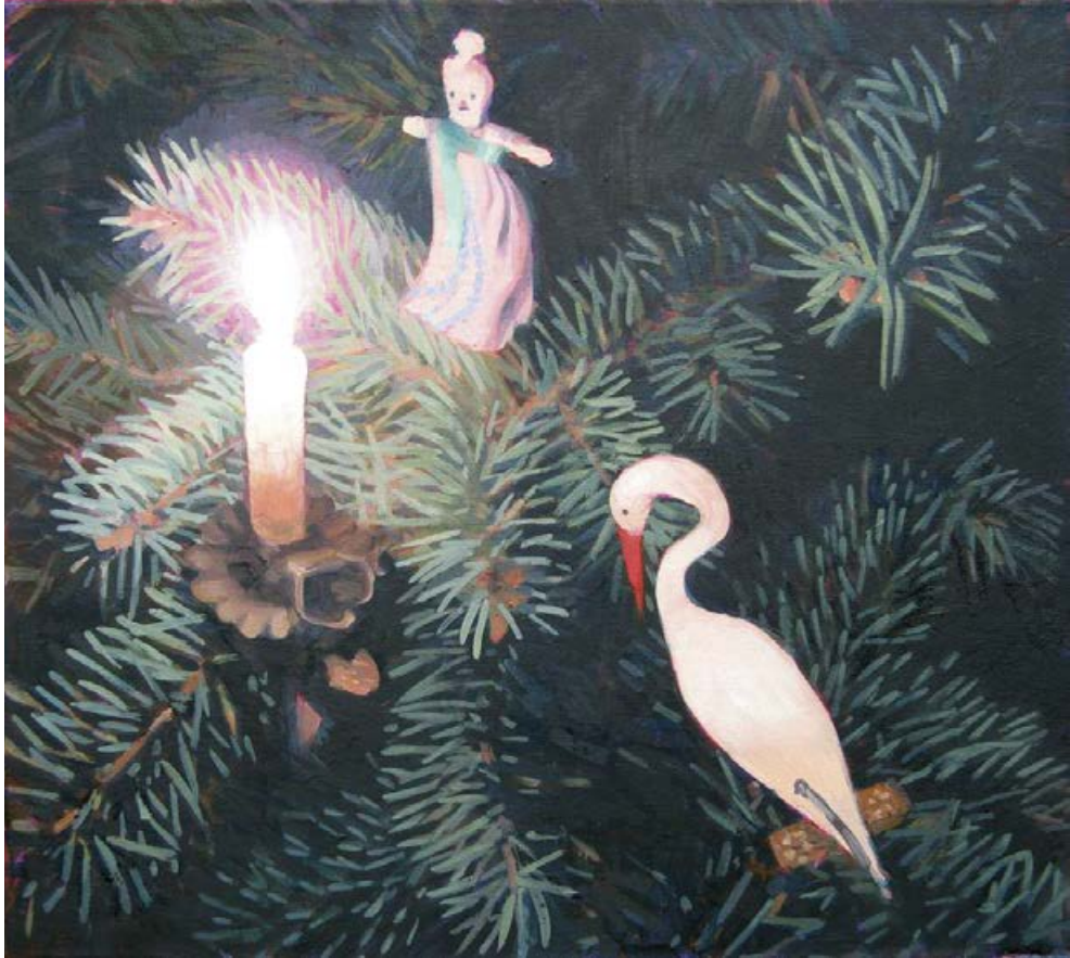
Am Baum V 2011, 39 x 36 cm Mischtechnik auf Leinwand