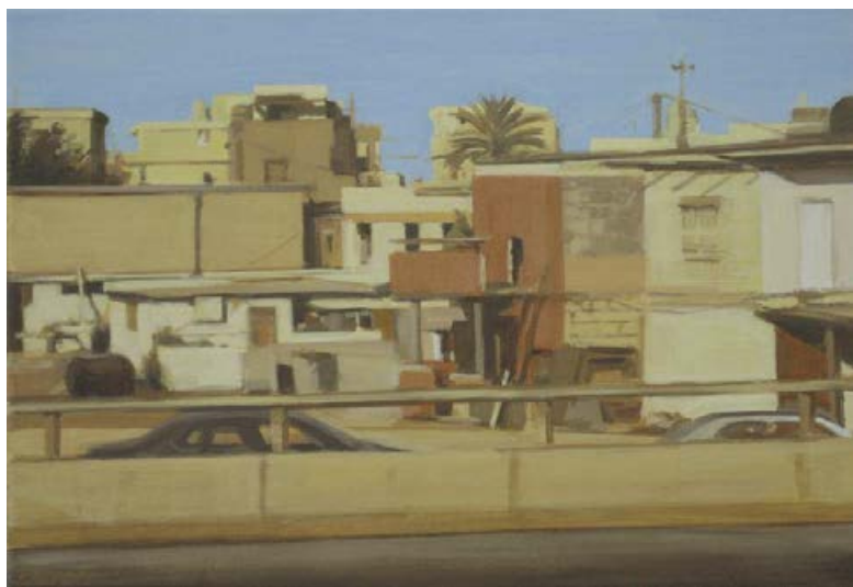
Beirut 2010, 44 x 30 cm Mischtechnik auf Leinwand