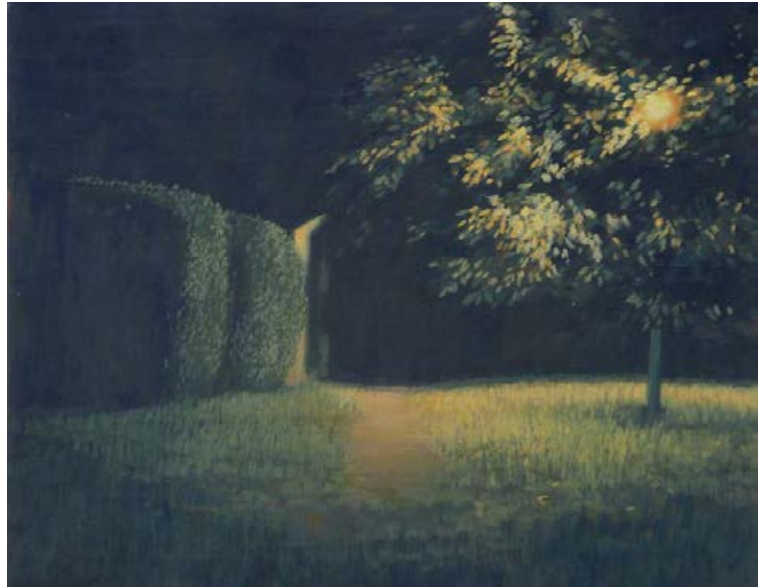
homezone nachts I 2009, 60 x 50 cm Mischtechnik auf Leinwand

Katrin Kunert gibt ihren Bildern ihren eigenen Blick auf die Welt mit. Sie ist nicht auktorialer Erzähler, was deutlich an der Wahl des Bildausschnittes sichtbar wird, der sich mehr am Detail als am großen Ganzen orientiert. Angeschnitten, herangezoomt und meistens auf Augenhöhe kann man die Bilder Katrin Kunerts fast wie durch eine Kamera betrachten. Eins der wenigen Bilder, die mehr Weite zeigen, ist Fabrik im Tal (S. 29). Aber auch hier bekommen wir keinen Überblick über das Gelände, sondern eine Landschaft, deren übergeordnete Struktur und Verlauf uns verborgen bleibt. Dieses Prinzip treibt Katrin Kunert in der Bildserie Am Baum I-V (S. 38, 39, 49, 50, 51) auf die Spitze. Es ist keine Horizontlinie mehr zu erkennen, die uns Abstand und somit auch die Herstellung von Bezügen und letztlich eine gewisse Einordnung zubilligt. Sie geht immer näher heran, bis dessen Laubwerk so dicht wird, dass es zur Wand, zu einer undurchdringlichen Mauer wird. Das Auge wird so nah herangeführt, dass sich die Räumlichkeit zugunsten von reinen Flächen und Farben auflöst. Was übrig bleibt, ist ein fast abstraktes Bild, ist Rhythmus und Gefühl.