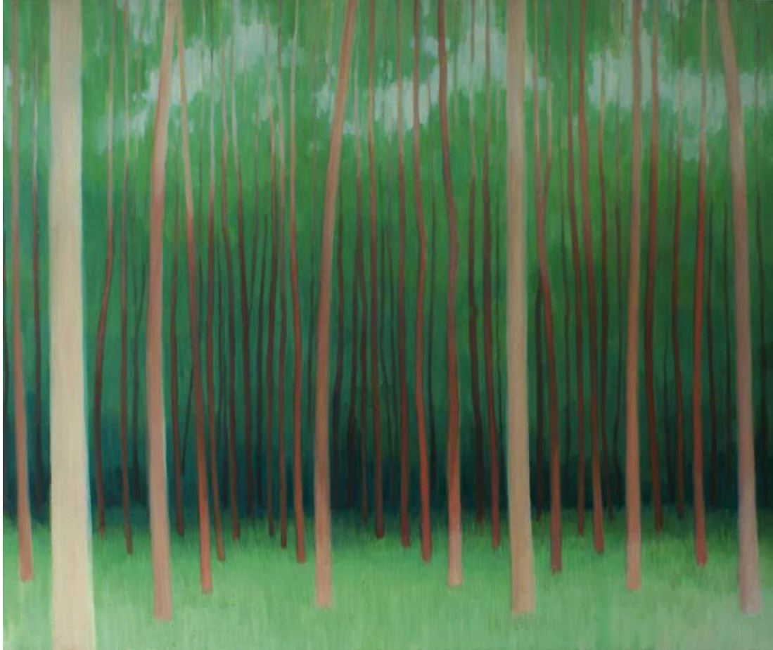
Märkischer Wald 2004/05, 120 x 100 cm Mischtechnik auf Leinwand