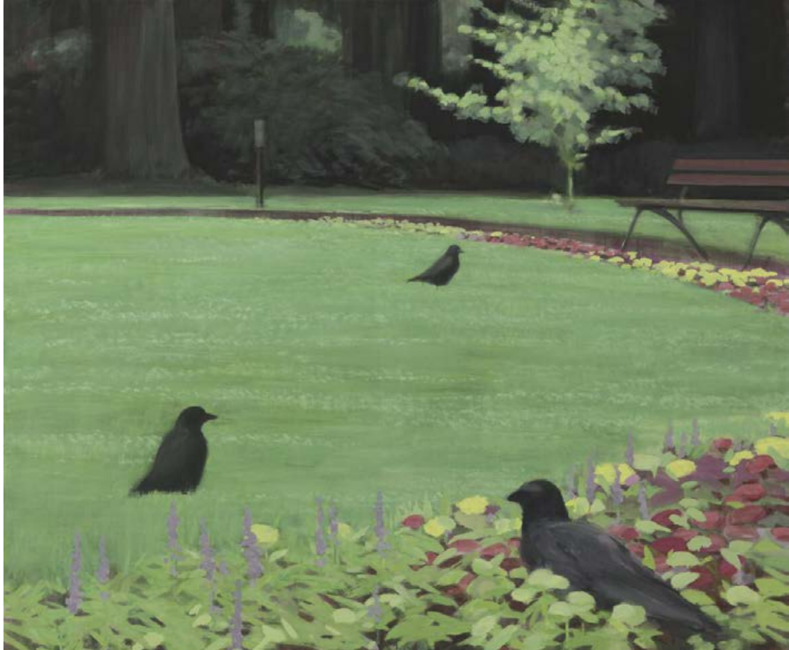
Krähen im Park 2007, 125 x 100 cm Mischtechnik auf Leinwand