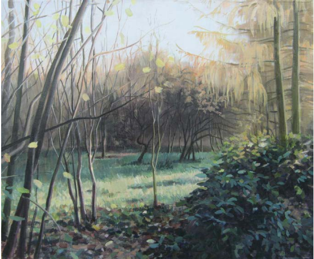
Späte Sonne II 2011, 65 x 50 cm Mischtechnik auf Leinwand