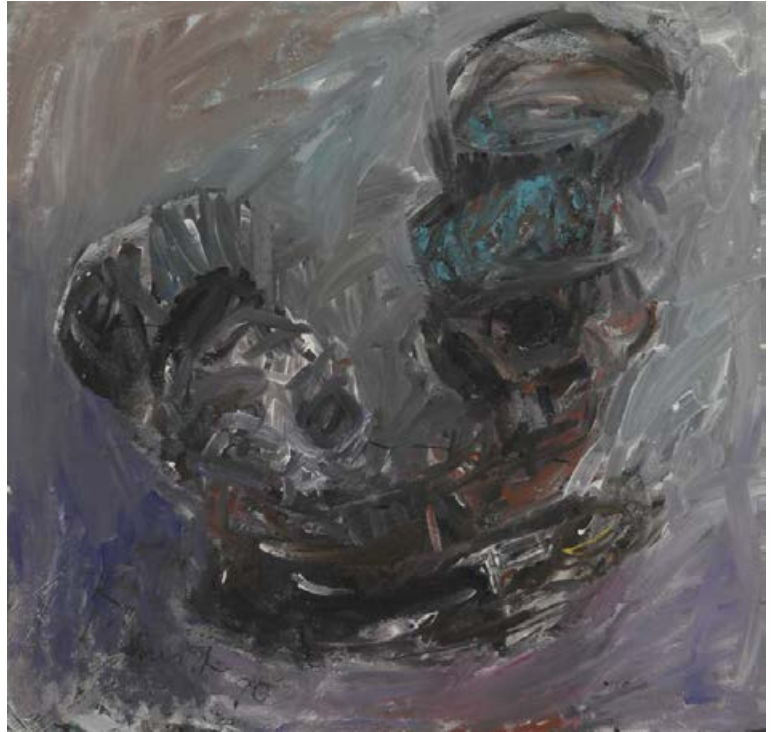
Kopfpfendel, zu Heiner Müller: Wolokolamsker Chaussee 1990, 73 x 73 cm Acryl auf Karton