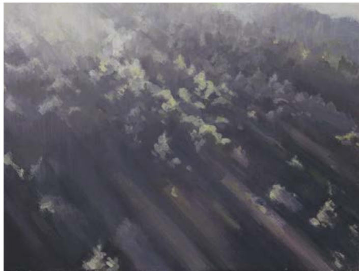
passe'l 2010, 40 x 30 cm Mischtechnik auf Leinwand