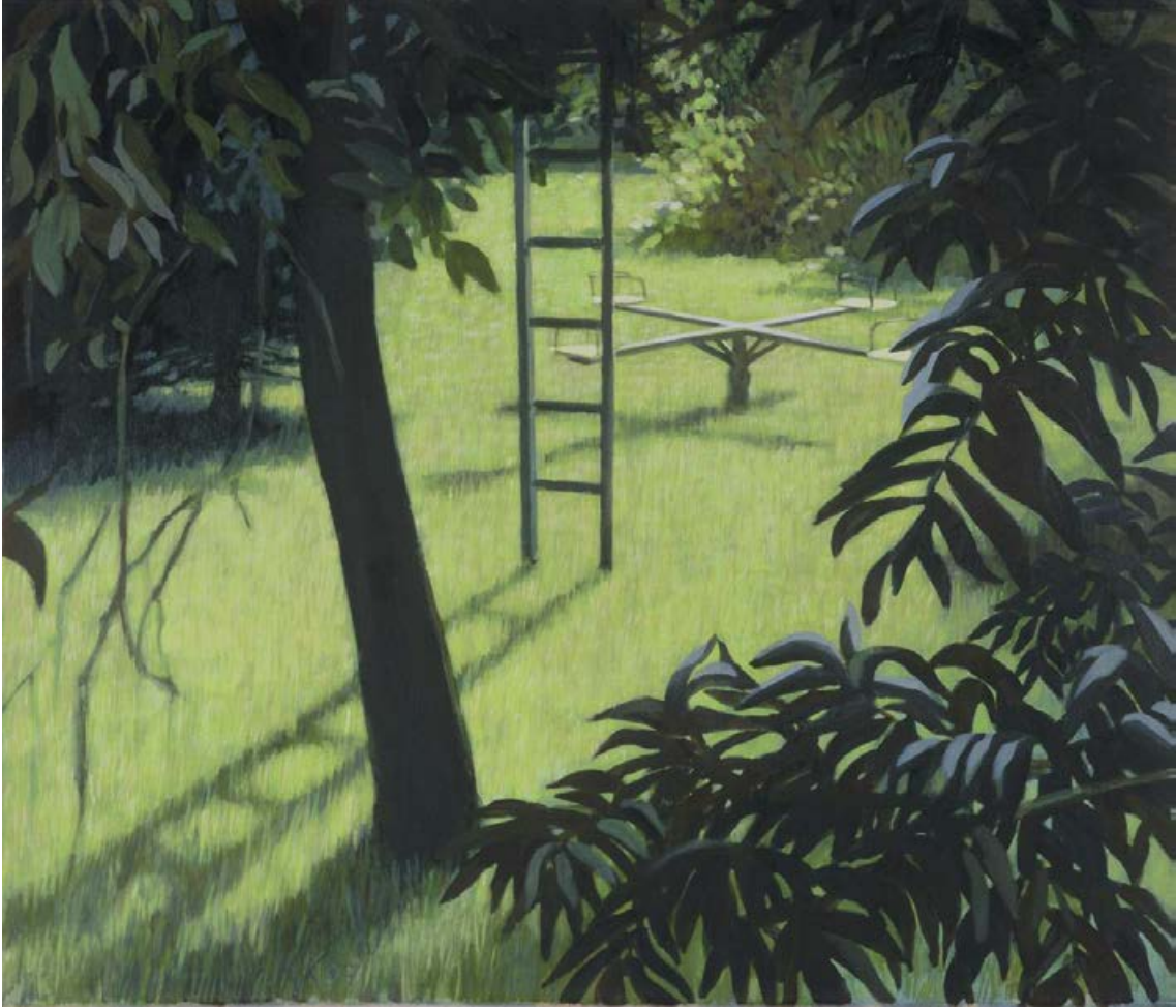
Leiter und Karussell 2007, 70 x 60 cm Mischtechnik auf Leinwand