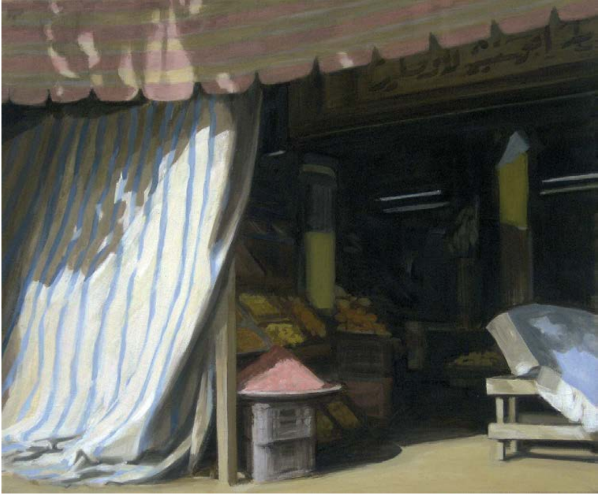
Basar 2009, 60 x 50 cm Mischtechnik auf Leinwand