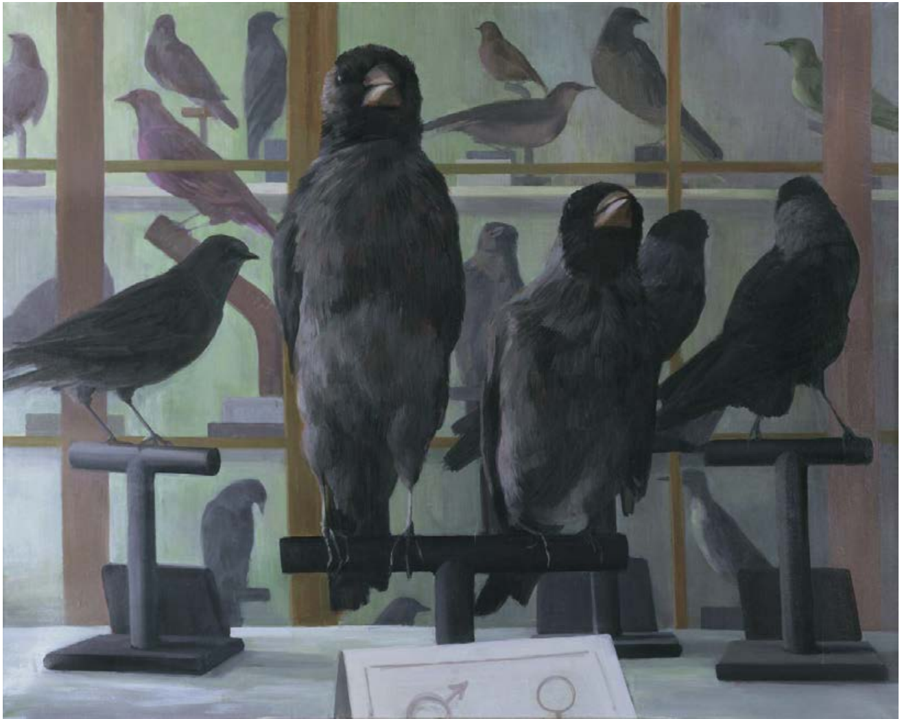
Vitrinenvögel III 2010, 150 x 120 cm Mischtechnik auf Leinwand