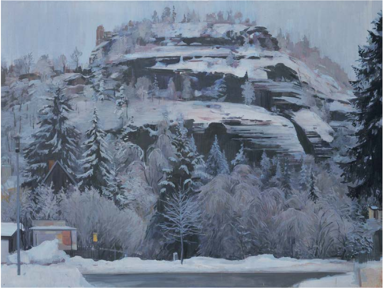
Oybin 2009/10, 140 x 110 cm Mischtechnik auf Leinwand