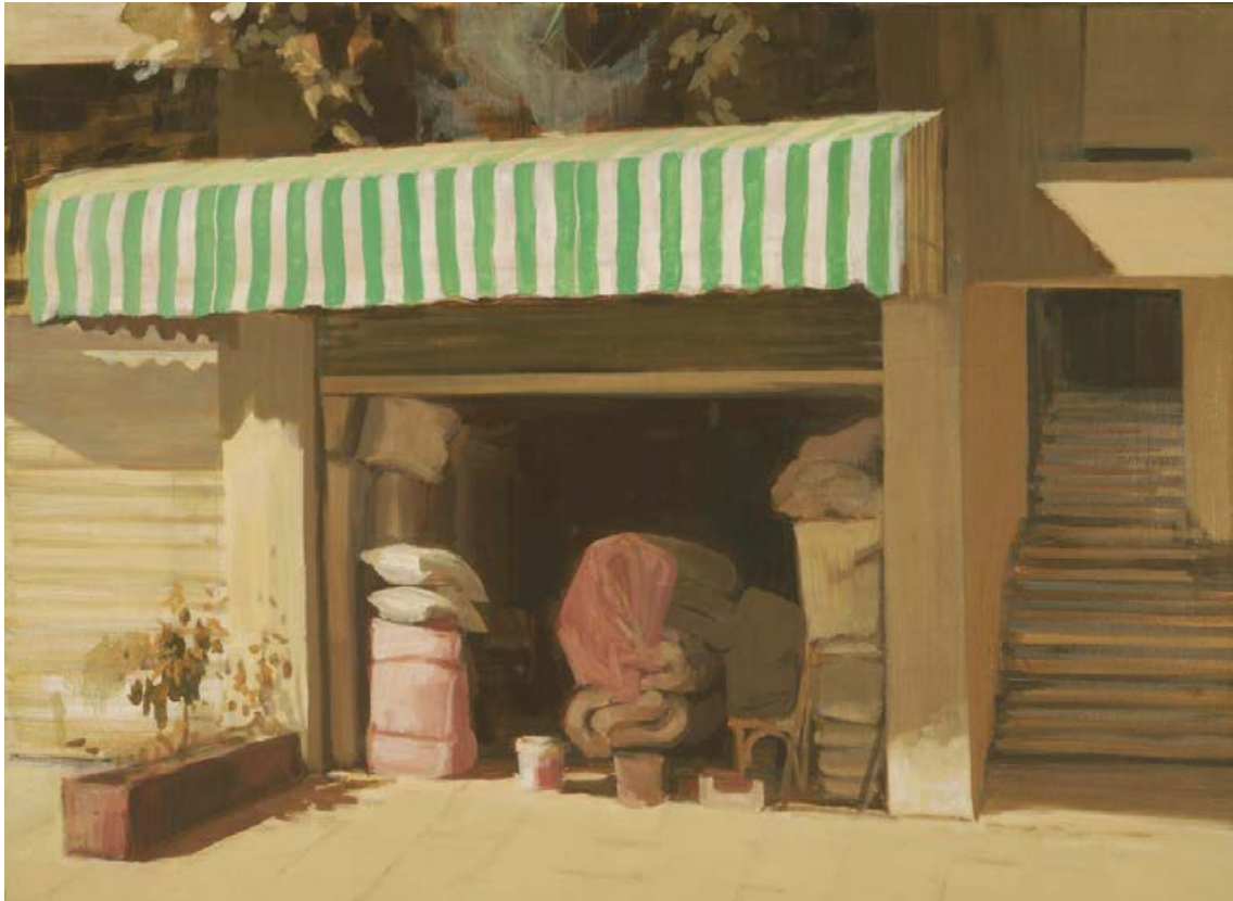
An der Straße nach Saida II (Libanon) 2009, 80 x 59 cm Mischtechnik auf Leinwand