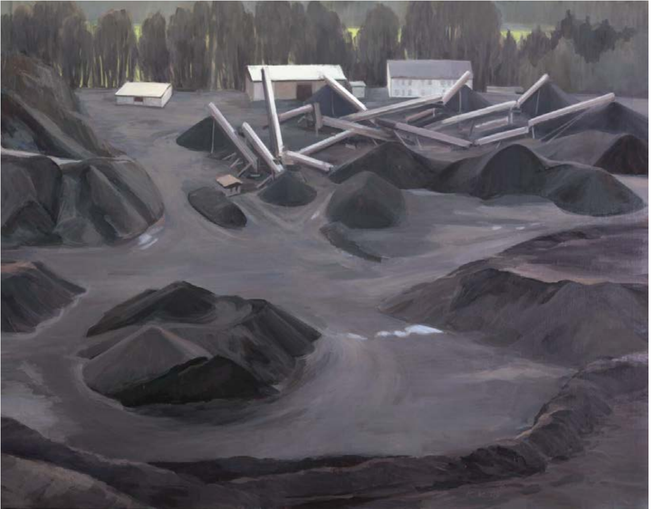
Abbau 2009, 140 x 100 cm Mischtechnik auf Leinwand