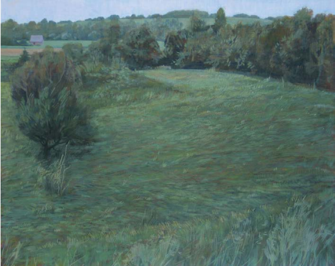
Kleine Rügenlandschaft I 2011, 70 x 56 cm Mischtechnik auf Leinwand