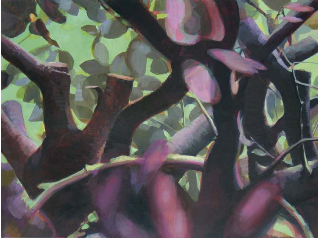
Im Apfelbaum 2011, 125 x 95 cm Mischtechnik auf Leinwand