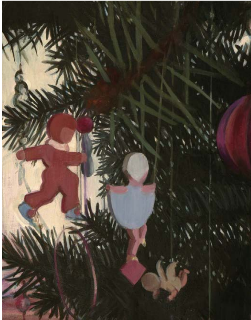
Am Baum II 2010, 50 x 60 cm Mischtechnik auf Leinwand