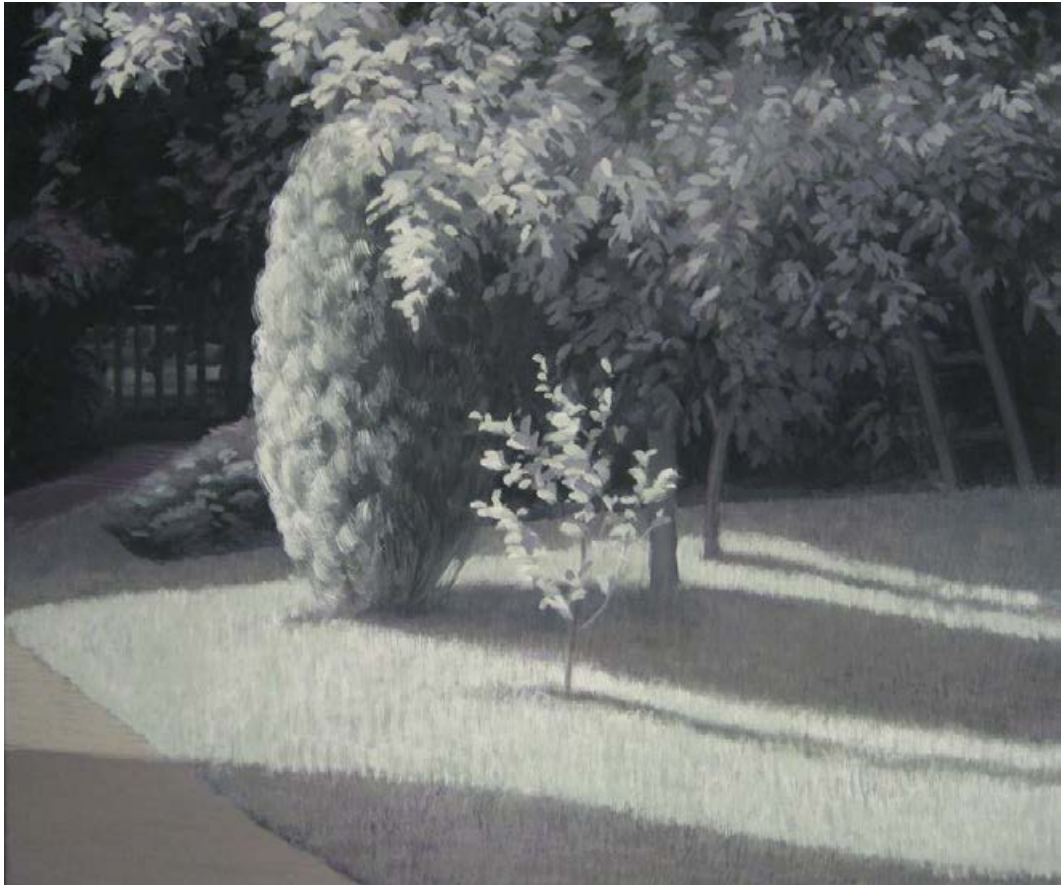
Die Leiter 2006, 65 x 55 cm Mischtechnik auf Leinwand