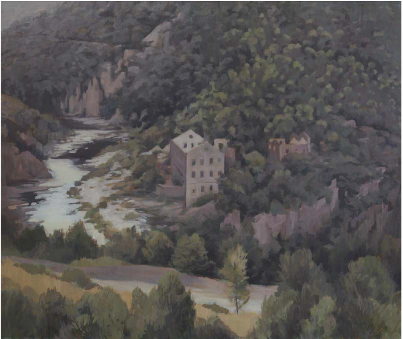
Fabrik im Tal 2008, 130 x 110 cm Mischtechnik auf Leinwand