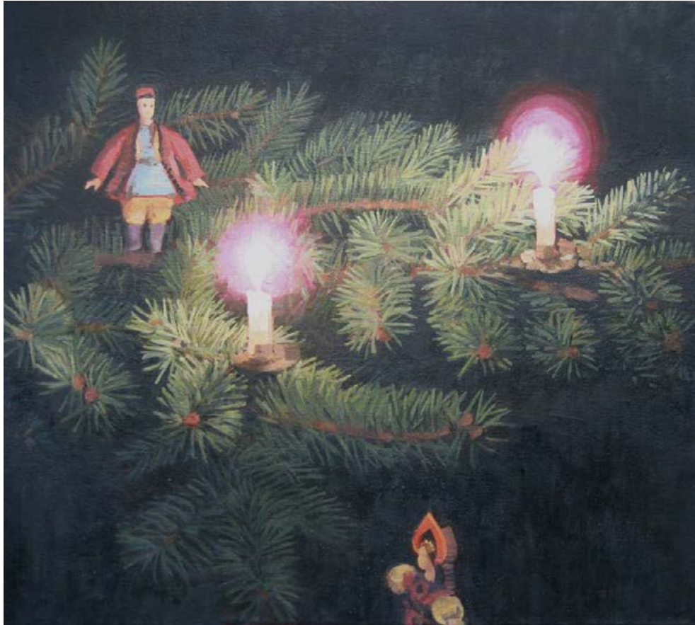
Am Baum IV 2011, 39 x 36 cm Mischtechnik auf Leinwand