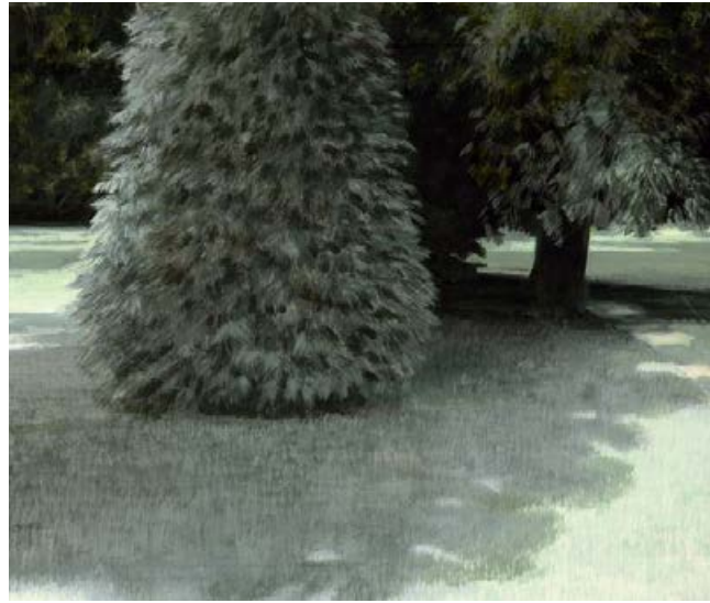
homezone IV 2006, 60 x 50 cm Mischtechnik auf Leinwand