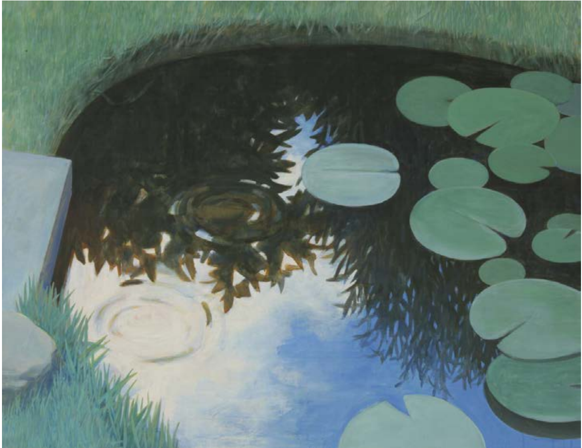
Teich II 2005, 140 x 110 cm Mischtechnik auf Leinwand