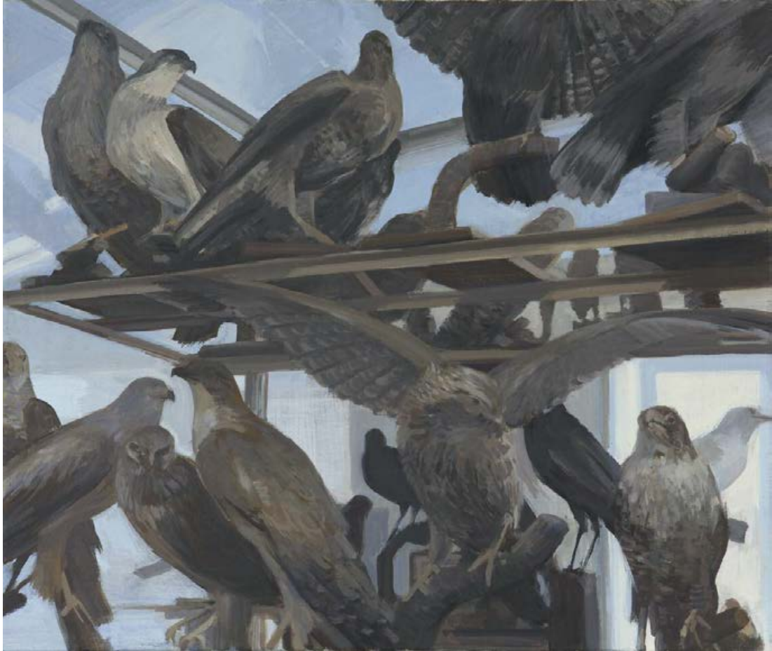
Vitrinenvögel II 2007, 65 x 55 cm Mischtechnik auf Leinwand