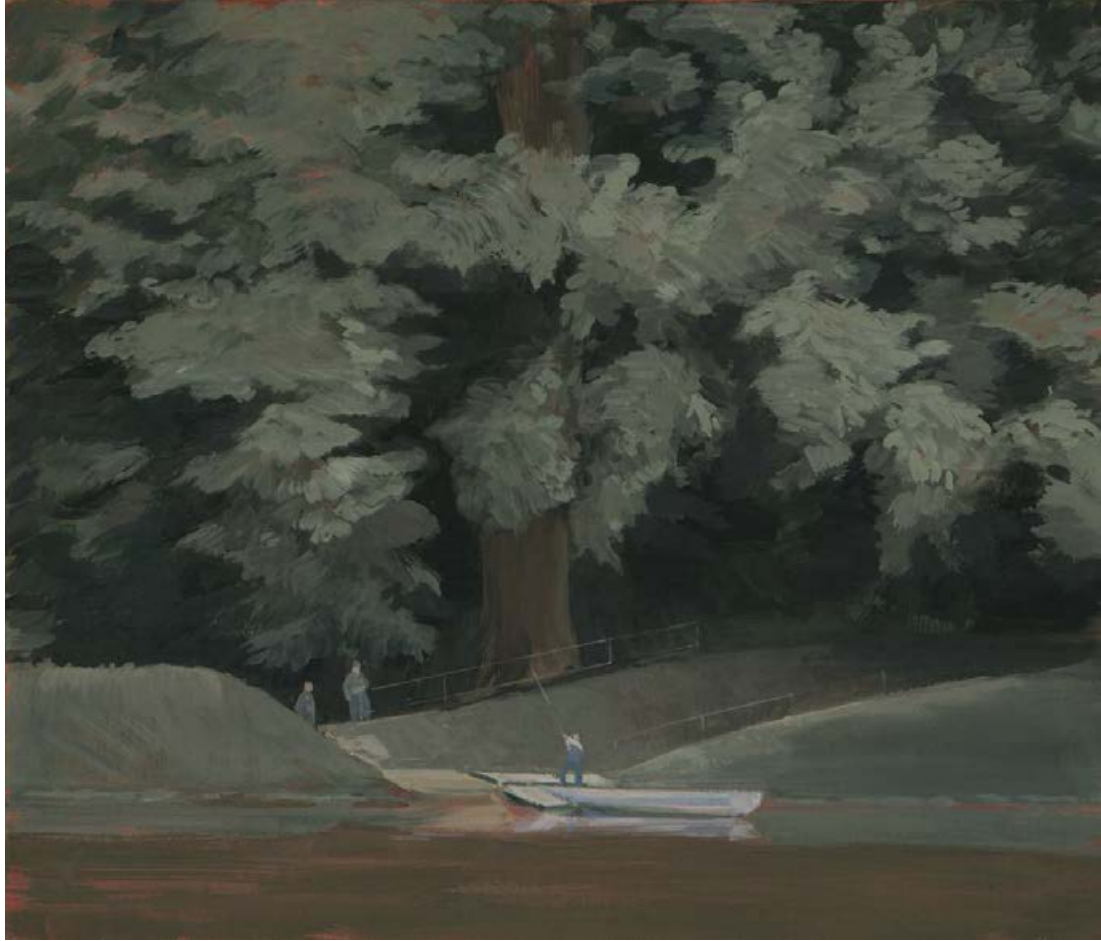
Fähre an der Mulde 2006, 65 x 55 cm Mischtechnik auf Leinwand