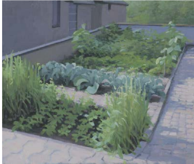
homezone I 2007, 60 x 50 cm Mischtechnik auf Leinwand