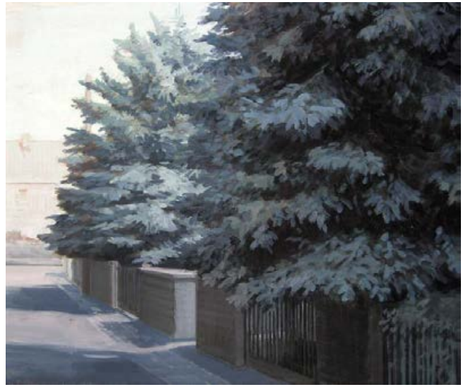
homezone V, VI 2006, je 60 x 50 cm Mischtechnik auf Leinwand