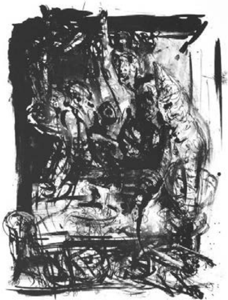
Das Spanienlied, zu Heiner Müller: Wolokolamsker Chaussee 1999, 44 x 53 cm Lithografie