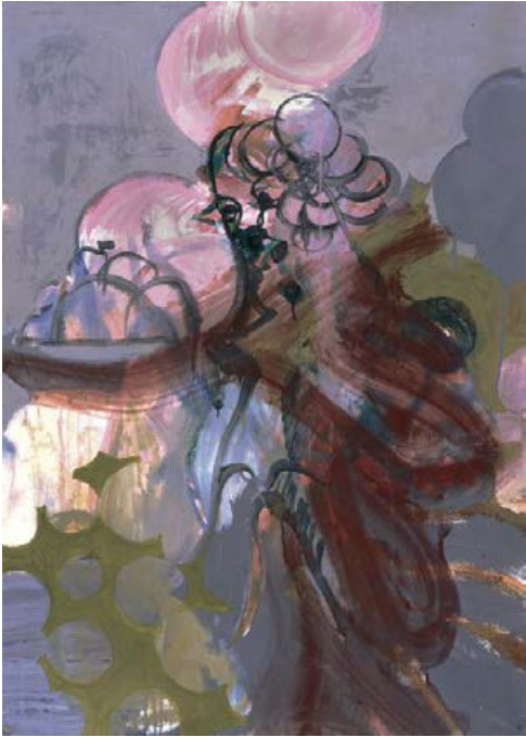
Brombeermädchen 1998, 73 x 102 cm Acryl auf Karton

dunklen, ins Elegische gebrochenen Welt, in der zerstörte Bäume wie Ruinen aufragen. Damit macht sie aus Koch eigentlich einen Romantiker, doch darum geht es ihr nicht, sie sucht nach neuen Ausdrucksmöglichkeiten und kommt mit beiden Adaptionen sich selbst näher, kann sich ihres Vermögens versichern, hat die beiden unterschiedlichen Künstler in ihre Kunstwelt umgeschrieben, sie sich angeeignet, wie sie zugleich wieder entlassen, dabei neue Räume ihrer Kunst betreten.