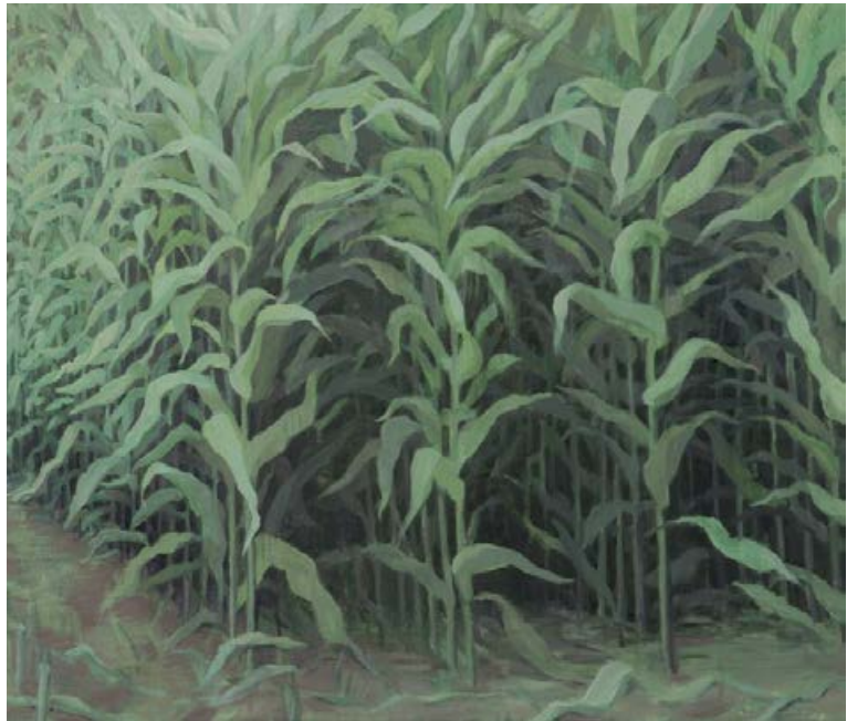
Maisfeld 2005, 100 x 80 cm Mischtechnik auf Leinwand

Maler, Modell und Abbildung. Auch bei ihr ist das Porträt ein Spiegelbild des Charakters, der Seele des Abgebildeten. In Vitrinenvögel III (S. 11) sind es beinahe einzelne Charaktere, die dem Betrachter frontal entgegenblicken, die, wären sie nicht ausgestopft, jeden Moment lospicken könnten. Hier ist es gleich ein ganzer Hofstaat, der sich breitmacht.