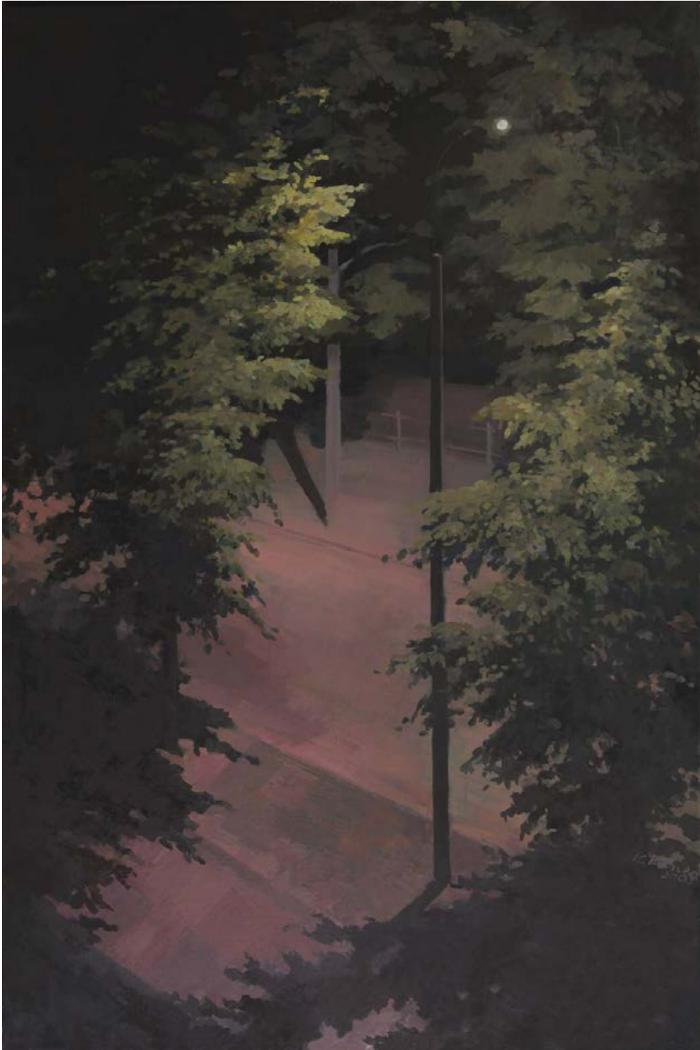
Straße, nachts 2009, 100 x 150 cm Mischtechnik auf Leinwand