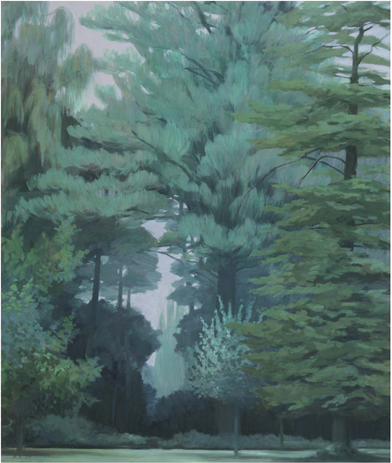
Wörlitz 2005, 150 x 180 cm Mischtechnik auf Leinwand