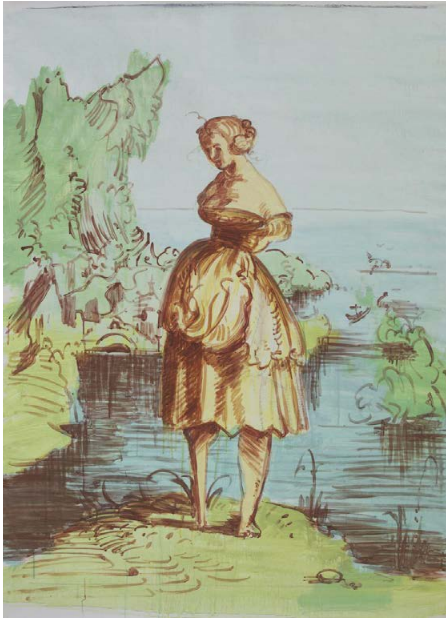
o.T., nach Urs Graf 2004, 100 x 140 cm Eitempera auf Karton