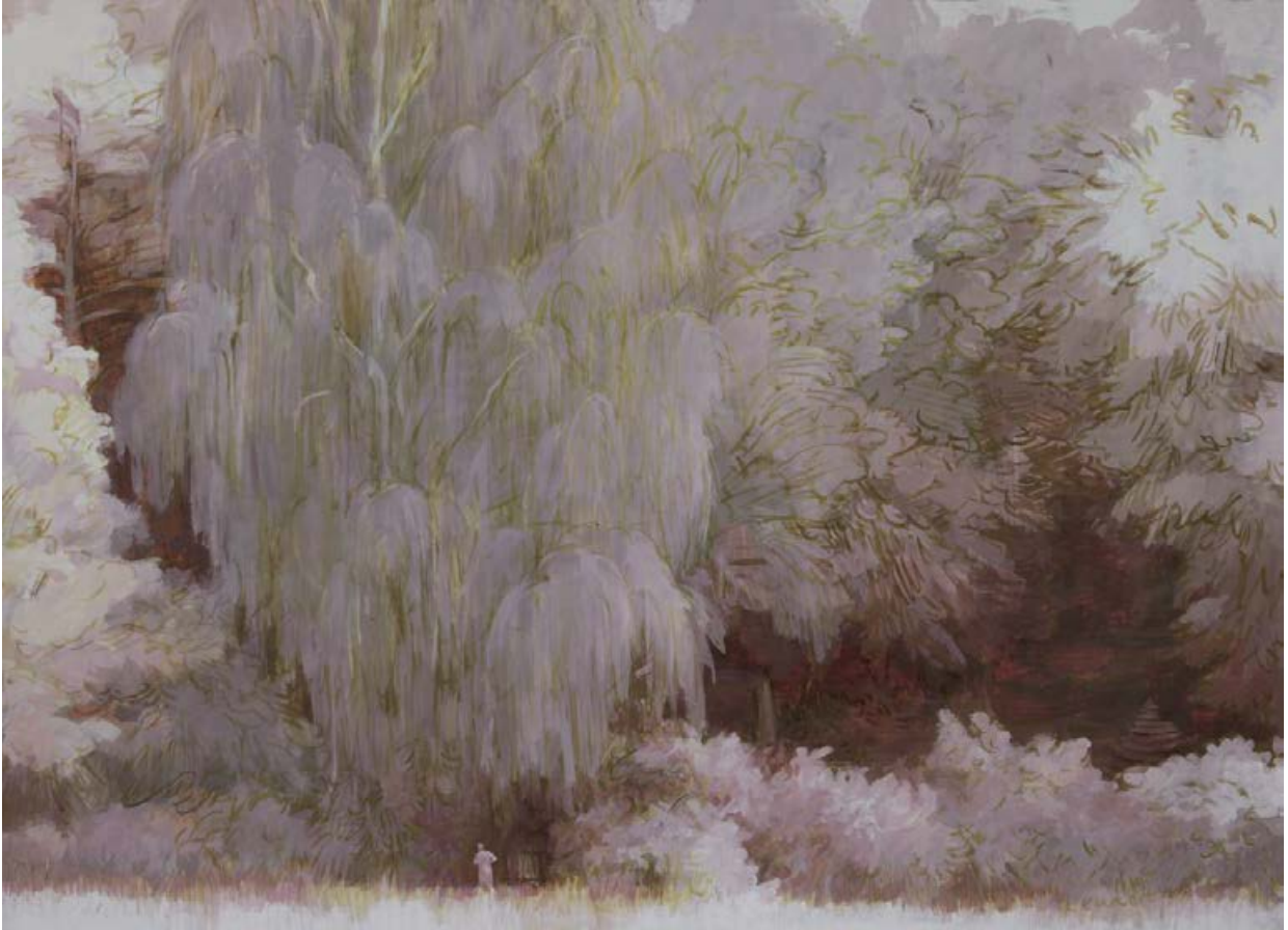
Große Birke 2007, 140 x 100 cm Eitempera auf Karton