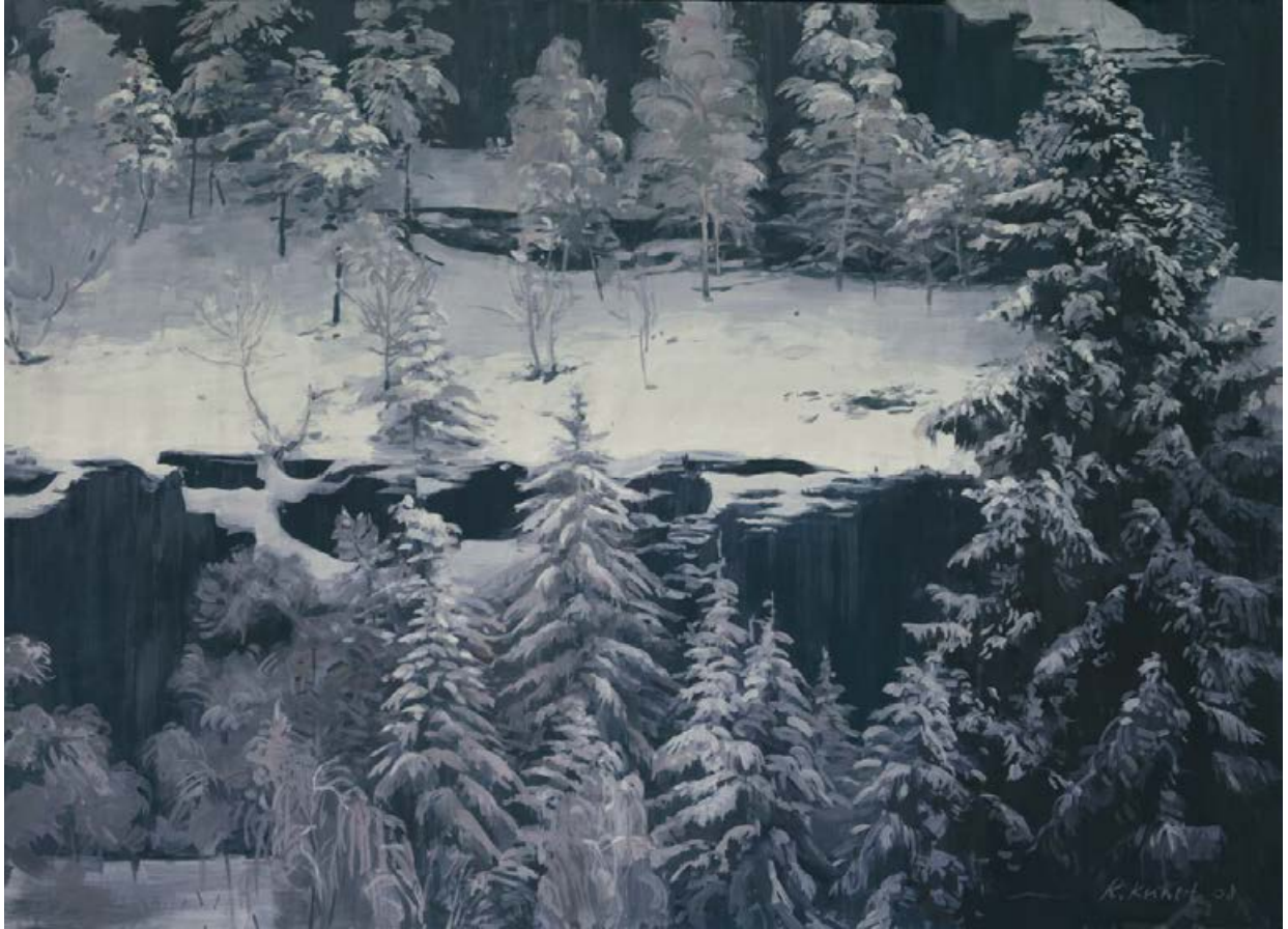
Am Oybin 2007, 140 x 100 cm Eitempera auf Karton