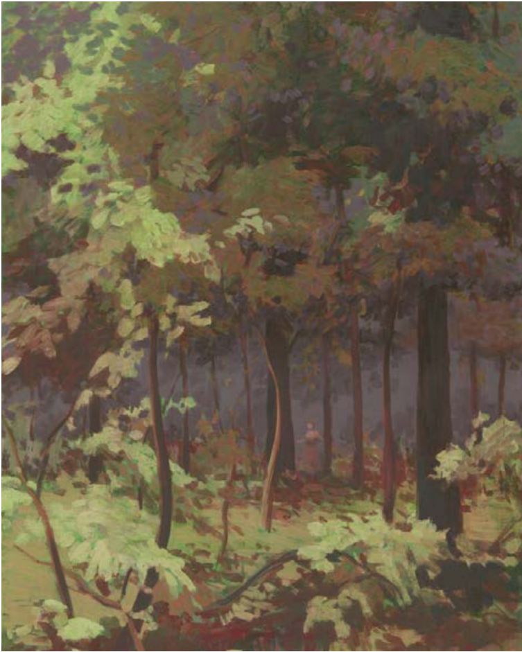
Roter Wald 2005, 60 x 80 cm Mischtechnik auf Leinwand

rissen, den auch Katrin Kunert nicht kennt, auch wenn Hitchcocks Vögel nicht weit sind. Invasion (2005), Stare auf einer Wiese picken gierig nach blutroten Kirschen, Ungeheuer in fremder Wildnis. Unschärfen sind auszumachen, Nähe und Ferne gleiten in eins. Kühle, blaugrüne Farbe, Verschattungen, darin das Braun-Schwarz der Vögel mit dem Signalrot vor einigen Schnäbeln. Die Zeit scheint angehalten, wie festgefroren. Stare unterm Kirschbaum (S. 35) und Krähen im Park (S. 48) variieren das Thema. Zu Symbolen von Macht und Einfältigkeit werden die Vitrinenvögel (S. 11, 20, 21), ausgestopfte Attrappen, leblose Gespenster, in Sammelwut zueinandergestellt, scheinen sie in drängender Enge menschliche Hierarchien zu spiegeln, ironisch bis hin zum Vogelgesteck (S. 9), einer skurrilen Groteske.