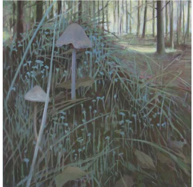
Grundstück, Pilze 2005, je 80 x 80 cm Mischtechnik auf Leinwand