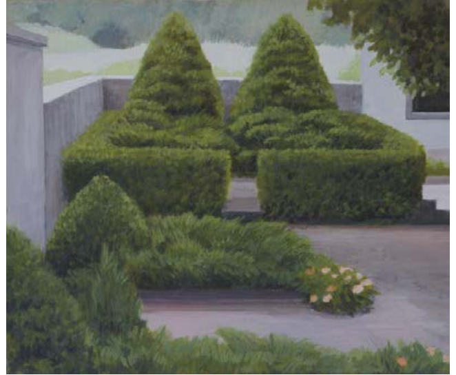
homezone II, III 2006, je 60 x 50 cm Mischtechnik auf Leinwand