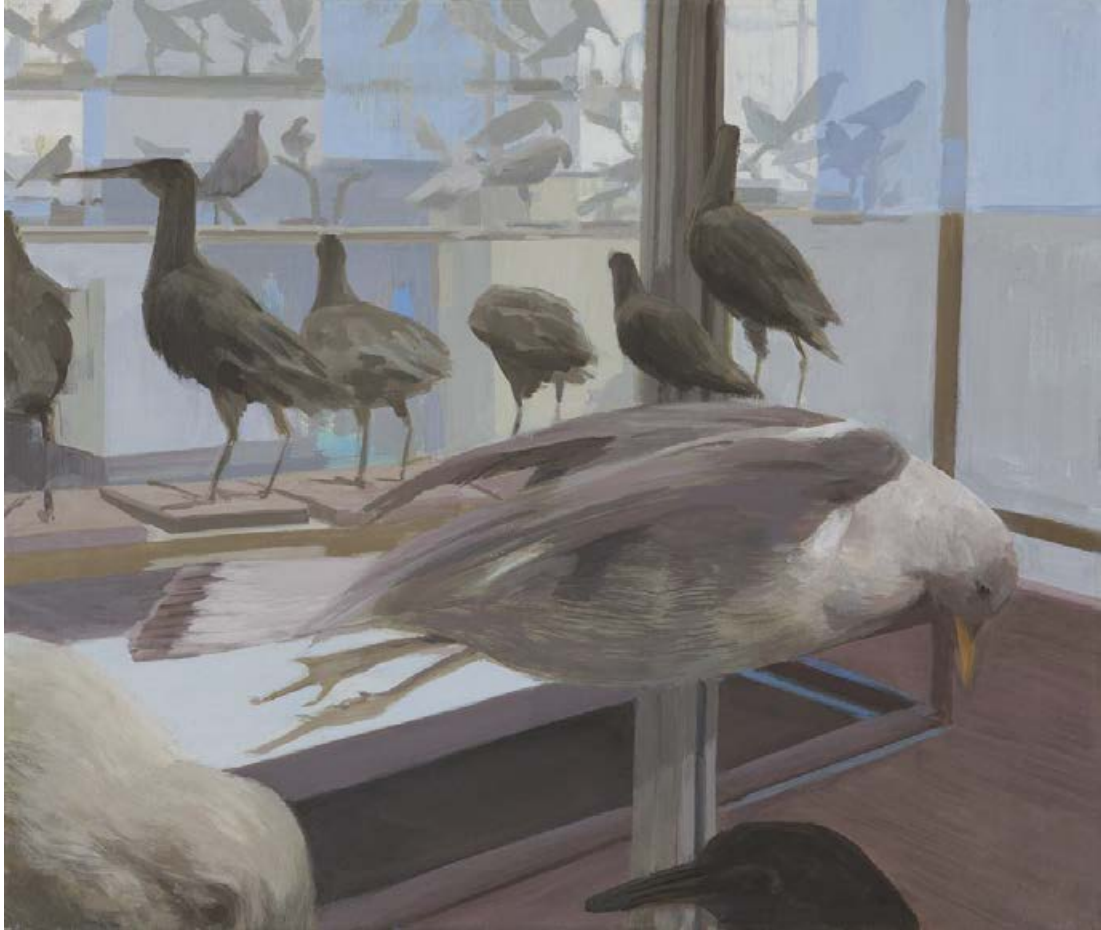
Vitrinenvögel I 2007, 65 x 55 cm Mischtechnik auf Leinwand