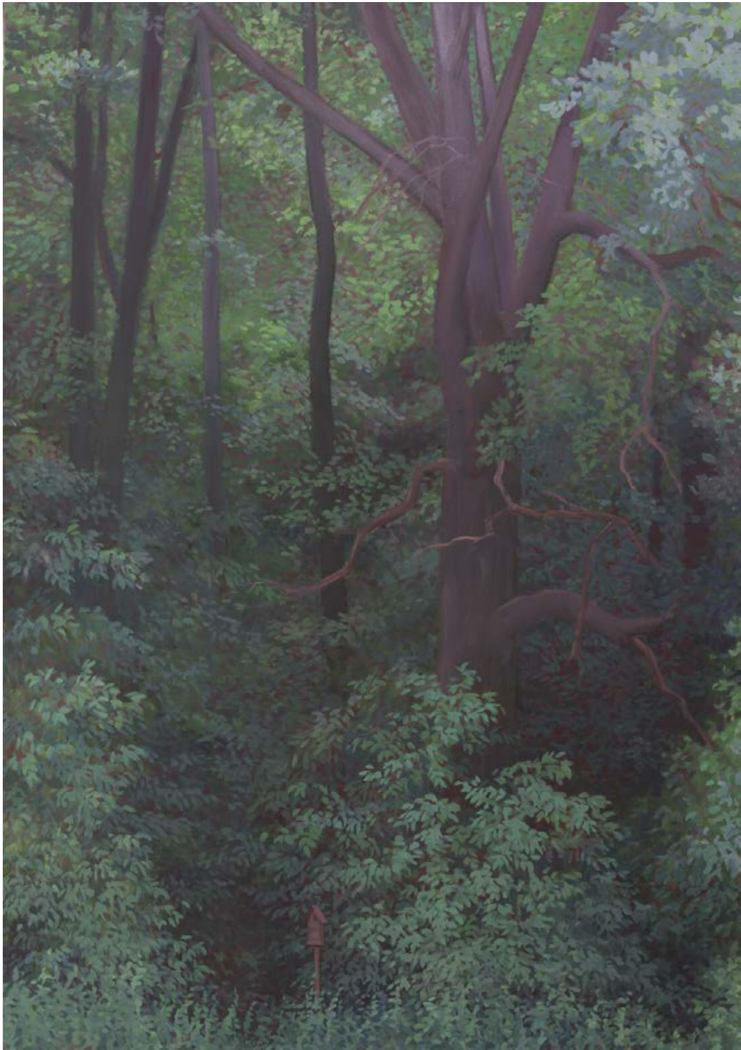
Roschertal 2007, 120 x 170 cm Mischtechnik auf Leinwand