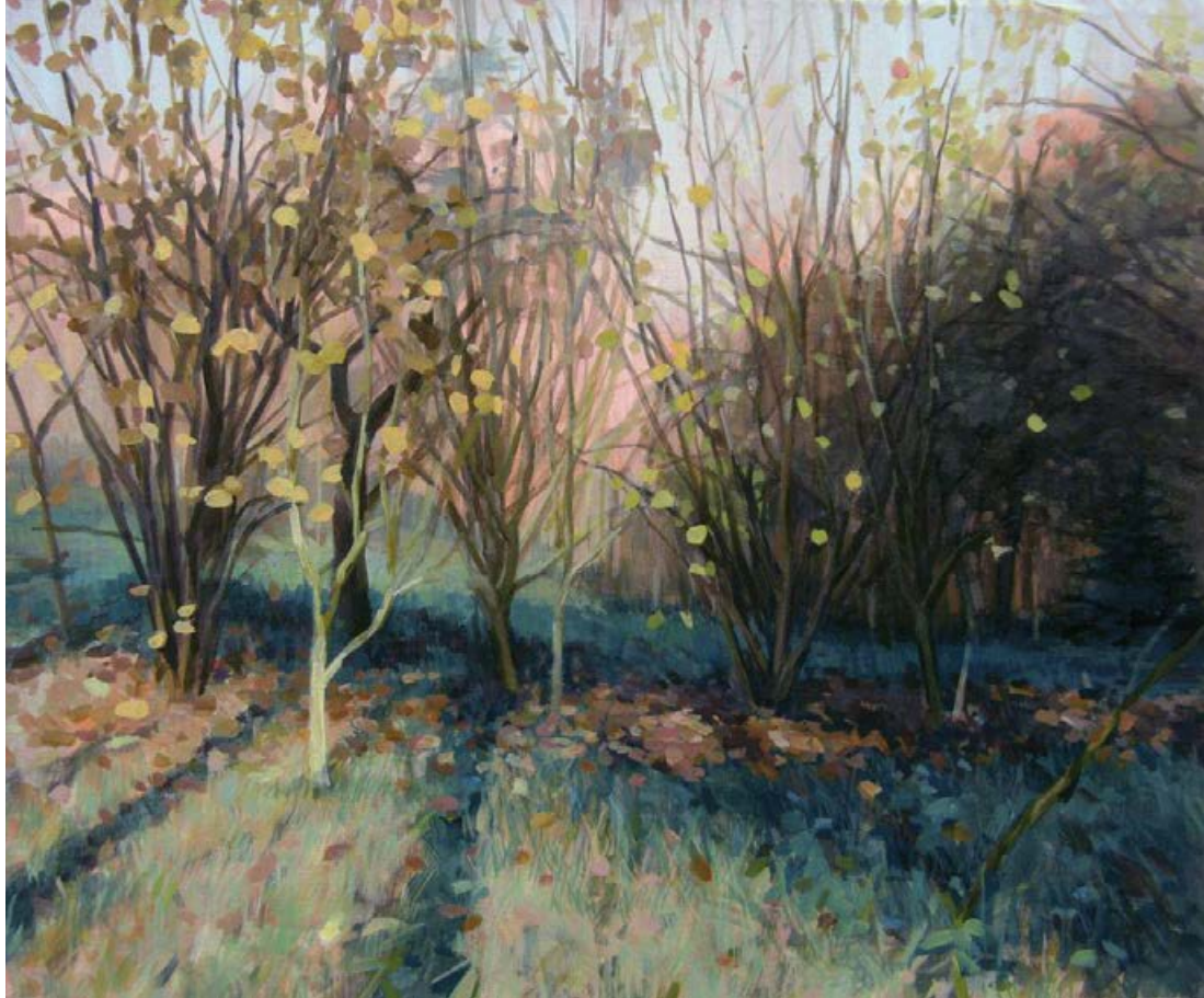
Späte Sonne I 2011, 65 x 50 cm Mischtechnik auf Leinwand