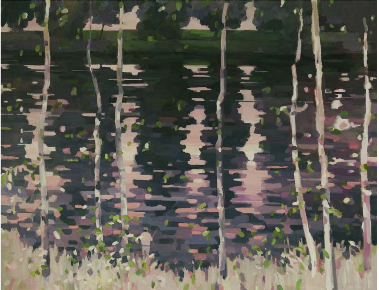
Angler am Kanal 2009, 195 x 150 cm Mischtechnik auf Leinwand