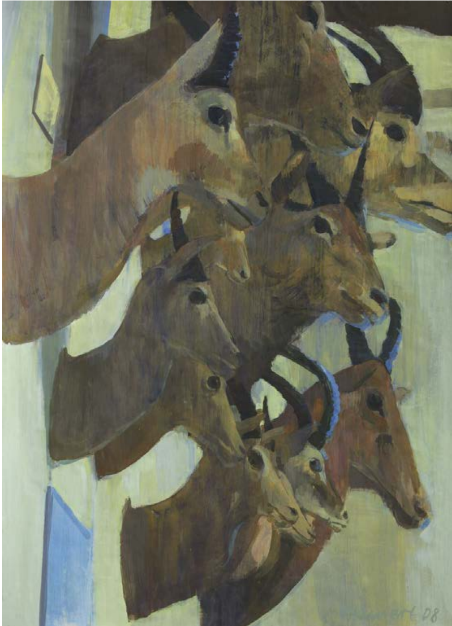
An der Wand 2008, 100 x 140 cm Mischtechnik auf Leinwand