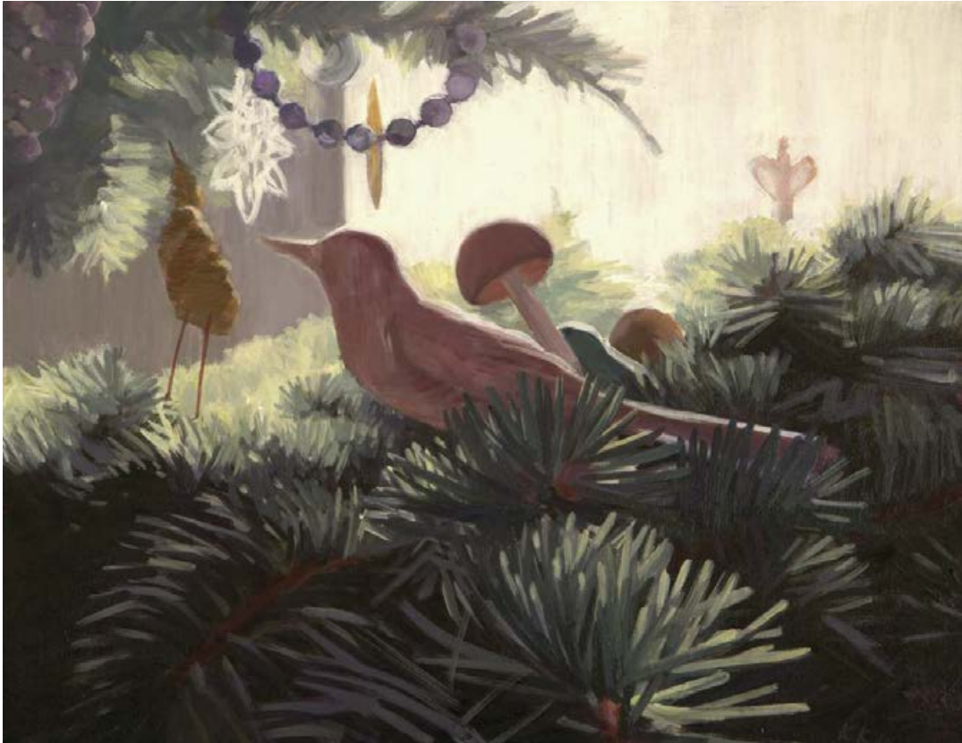
Am Baum III 2010, 50 x 60 cm Mischtechnik auf Leinwand