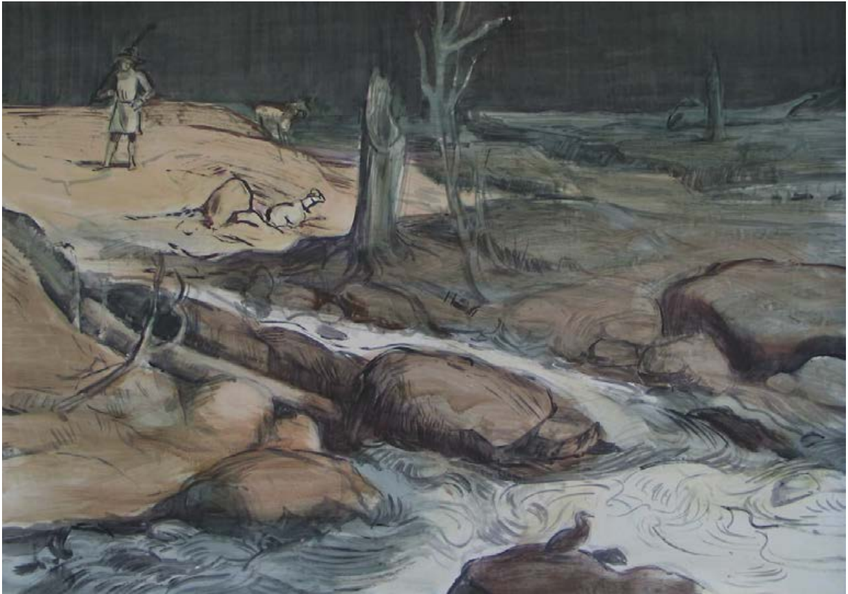
Pastorale, nach Joseph Anton Koch 2005, 140 x 100 cm Eitempera auf Karton