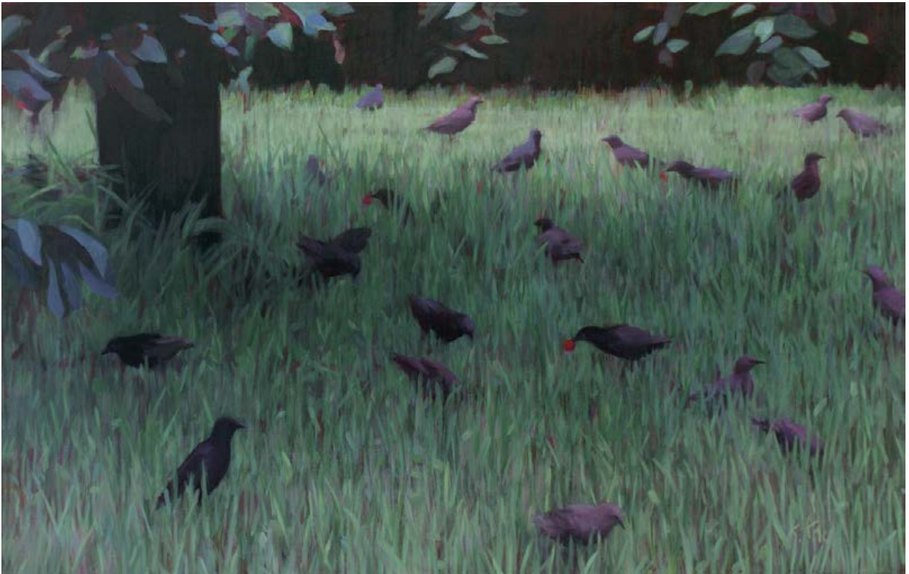
Stare unterm Kirschbaum II 2010, 110 x 70 cm Mischtechnik auf Leinwand