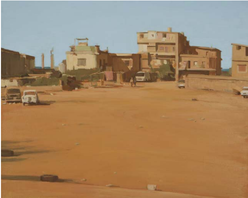
An der Straße nach Saida I (Libanon) 2008/09, 80 x 65 cm Mischtechnik auf Leinwand