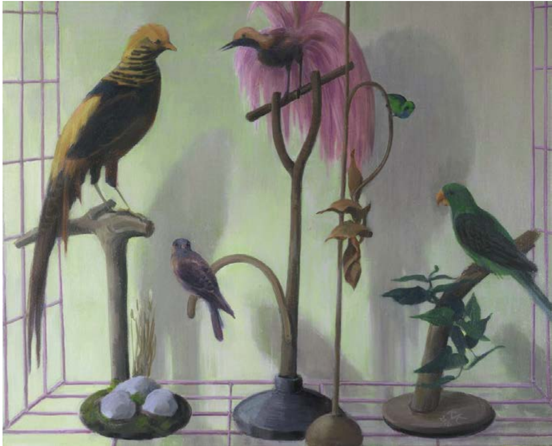
Vogelgesteck 2010, 65 x 53 cm Mischtechnik auf Leinwand